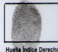
Huella Índice Derecho